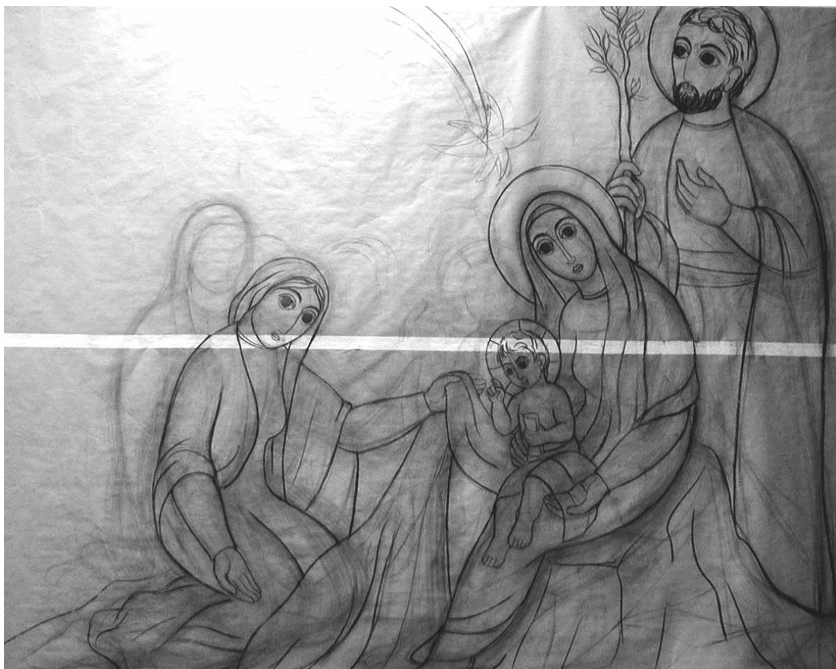
DISEGNO PER IL MOSAICO NELLA CAPPELLA DELLA RESIDENZA DEI GESUITI SAN PIETRO CANISIO A ROMA

Sant' Ignazio di Loyola, nella sua meditazione sulla nascita del nostro Signore, suggerisce uno scenario un po' inconsueto. Nella composizione del luogo da meditare, Ignazio mette nella grotta anche una serva che sta aiutando la Sacra Famiglia in questo evento eccezionale della nascita del Salvatore. Come tutta la tradizione occidentale dopo san Francesco, anche Ignazio si serve dell'immaginazione del presepe per aiutare i fedeli ad immedesimarsi con i santi personaggi, per partecipare ai loro sentimenti, al loro pensiero, e trarre così per loro stessi il profitto spirituale, cioè infiammarsi di più per il Signore, stringere il rapporto con Lui e trovarsi con Lui in un amore sempre più reciproco.