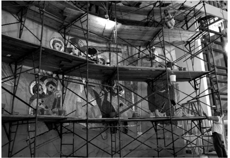
LAVORO ALLA SACRED HEART UNIVERSITY

Siamo tornati negli Stati Uniti e, forse, se qualcuno di voi ricorda ancora il racconto del nostro primo arrivo lì nel 2005, gli piacerà sapere che, anche se questa volta ci siamo andati d'estate, non c'era una grande differenza. Se quella volta era davvero inverno e faceva proprio freddo (-25°), ora, in pieno agosto, faceva comunque freddo. Sembra proprio che gli americani preferiscano l'inverno, e per questo si sparano aria condizionata a getto continuo e dappertutto. E dopo la prima notte lì, ognuno ha aguzzato l'ingegno per tappare i fori dell'aria condizionata nella stanza, qualcuno arrivando perfino a usare i calzini... sporchi!