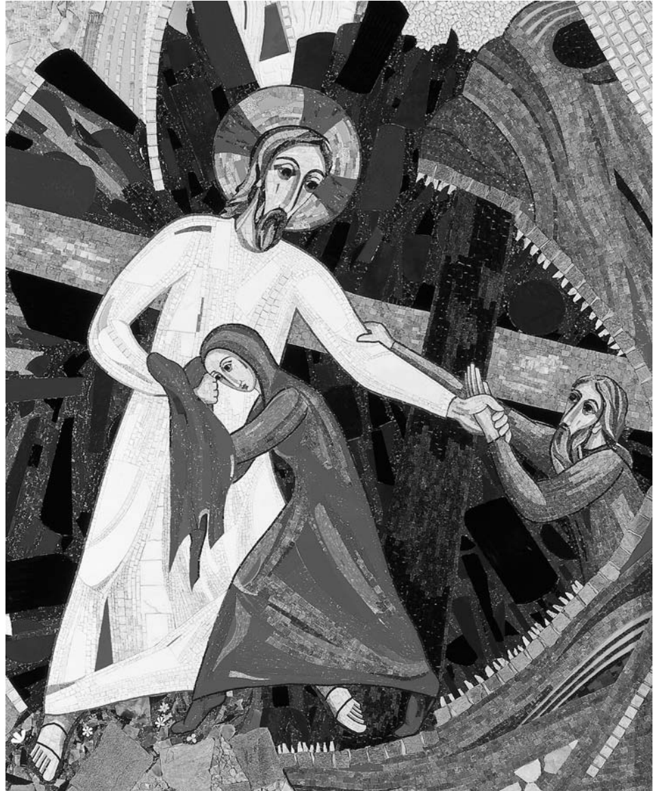
Discesa agli inferi - Chiesa di San Michele, Grosuplje

Correrò e chiuderò le porte dello Sheol davanti a questo Morto la cui morte mi ha rapinato. Chi sentirà ciò si meraviglierà della mia umiliazione, perché sono stata sconfitta da un Morto venuto da fuori: tutti i morti vogliono andare fuori,