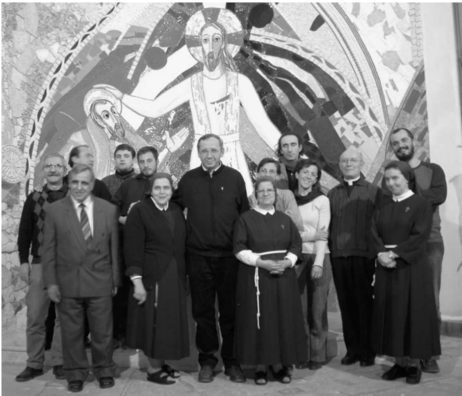
L'equipe dell'Atelier e la comunità della nunziatura