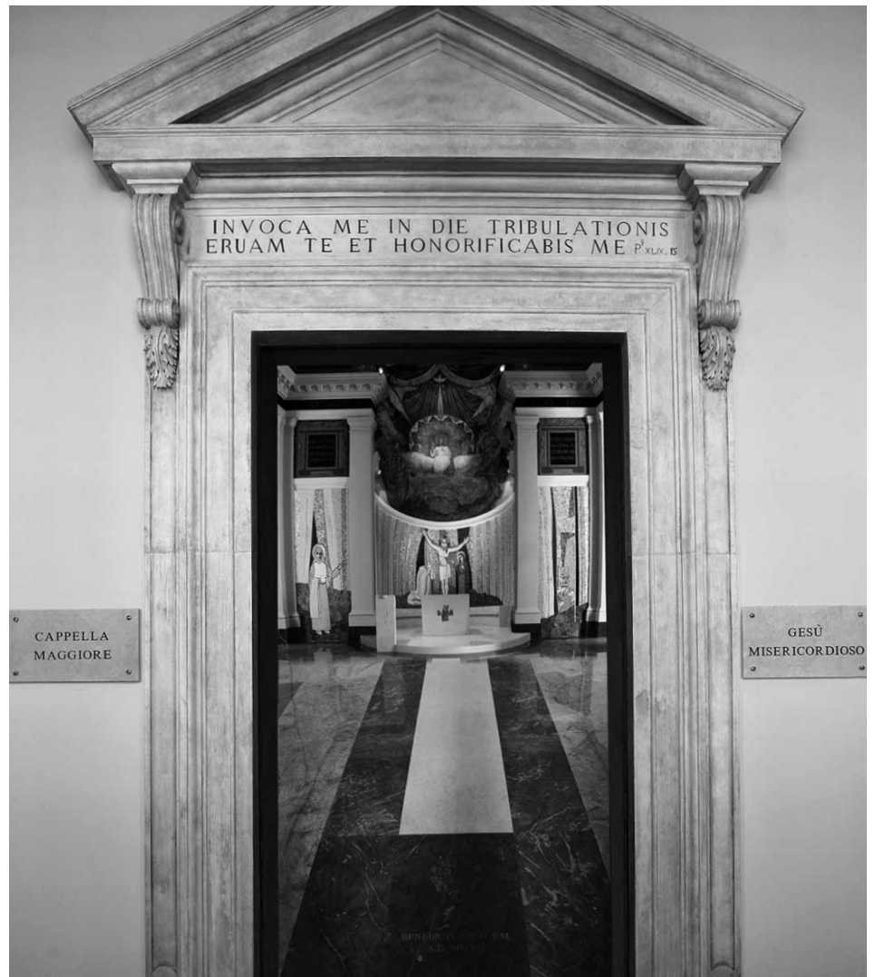
Qui e alla pagina seguente: Cappella del Policlinico Umberto I a Roma

corpo di Cristo. Cosa diventano quelli che lo ricevono? Corpo di Cristo (Giovanni Crisostomo). Ora, l'eucarestia, come ogni altro sacramento, ci dischiude le dimensioni di questa comunione: si tratta sempre di una comunione tridimensionale – verso Dio, verso gli altri e verso il cosmo che, inglobato in questa comunione, diventa cosmo redento, spazio sacramentale, la terra nuova che esprime la nostra cooperazione all'energia dello Spirito Santo. Attraverso la fatica e il lavoro umano, nella sinergia con lo Spirito Santo, la terra acquista un volto e fa trasparire la verità del mondo creato secondo il disegno del Creatore. Proprio questo accade nella liturgia e nei sacramenti. Perciò la Chiesa comprende che occorre porre una grande attenzione allo spazio in cui essa celebra il suo Signore. L'edificio, lo spazio della liturgia, trova il suo fondamento nell'identità della Chiesa stessa e in ciò che in essa si celebra, spazio vivo nella misura in cui ospita la vita per cui è stato creato. Il santuario è spazio sacramentale della Chiesa, e proprio per questo la chiesa-edificio manifesta la realtà della Chiesa. L'ordine della