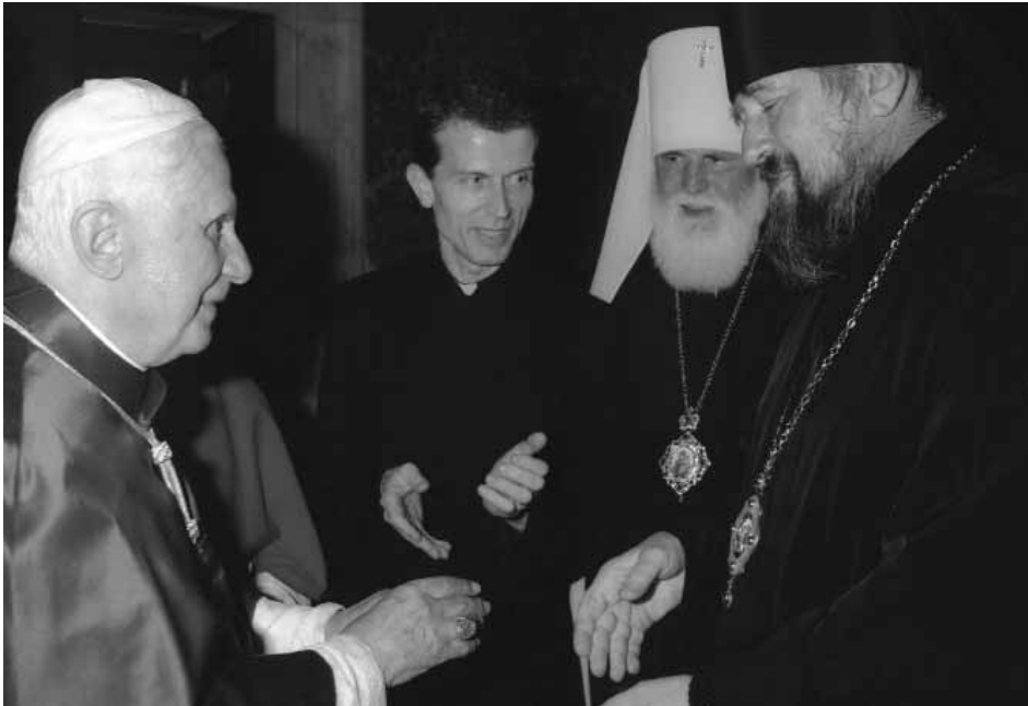
P. MILAN TRADUCE IL COLLOQUIO TRA IL PAPA E DUE VESCOVI ORTODOSSI

andare oltre i conflitti e le tensioni e che può di nuovo unirli. Nella preghiera, nel rapporto con il Padre, con il Figlio e con lo Spirito Santo, riceviamo quell'amore che purifica i nostri cuori dai pregiudizi per poter di nuovo incontrarci con gli altri, anche se diversi. Con gli incontri in quest'atteggiamento interiore, facciamo anche il possibile affinché lo Spirito Santo possa lavorare anche nelle altre persone per unirli tra di noi. Ci sono molti modi di impegnarci in questo: dagli incontri e colloqui alle conferenze, alla scrittura di articoli e di libri. L'essenziale però in tutto questo è l'atteggiamento della preghiera.