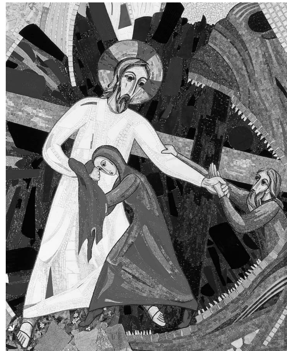
Spust v predpekel - cerkev sv. Mihaela, Grosuplje

Tekla bom in zaprla vrata Šeola pred tem Mrtvim, čigar smrt me je oropala. Kdor bo to slišal, se bo čudil mojemu ponižanju, kajti premagal me je Mrtvi,