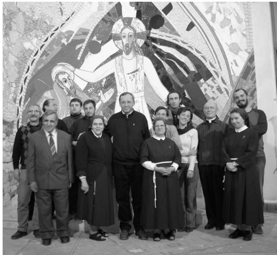
Ekipa Ateljeja Centra Aletti in skupnost na nunziaturi.

Intenzivno smo delali od sobote do naslednjega petka, da bi imeli na razpolago vsaj dva dni za ogled Sirije. Kakšna škoda bi namreč bila, če bi odšli iz Damaska, ne da bi obiskali Hananijevo hišo, ne da bi se sprehodili po Ravni ulici in ne da bi videli Dura Europos ter celo davno Palmiro sredi puščave!