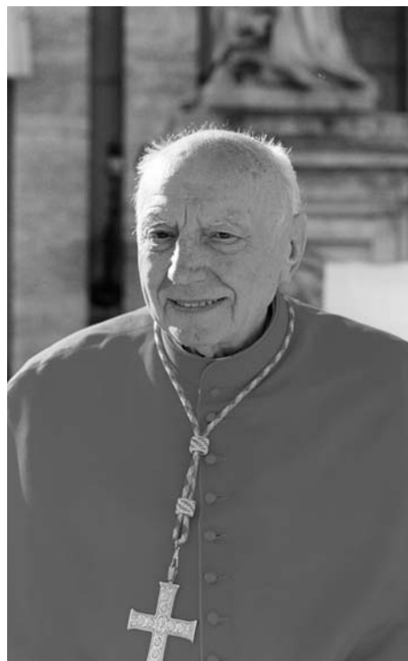
Kardinal Tomáš Špidlík

A vrnimo se k obisku na Češkem. Takoj po prihodu v Prago, 21. februarja, je p. Špidlík maševal v jezuitski cerkvi. Po končani maši so ga obkročili številni verniki, ki so želeli nasvet, podpis v knjigo, blagoslov, podobico ... Naslednji dan se je v celoti odvil v Špidlíkovem rojstnem kraju, v Boskovicah na Moravskem, približno 250 km od Prage. Najprej maša v župnijski cerkvi, ki se je napolnila do zadnjega kotička, saj so duhovniki iz okolice odpovedali dopoldanske maše in organizirali avtobusni prevoz, da bi tako svojim vernikom omogočili udeležbo pri tem dogodku; potem obisk redkih preživelih sorodnikov; kosilo v župnišču, srečanje z županom, predstavitev češkega prevoda knjige "Meništvo", četrtega dela Špidlíkovega dela o krščanskem vzhodu; večerja in