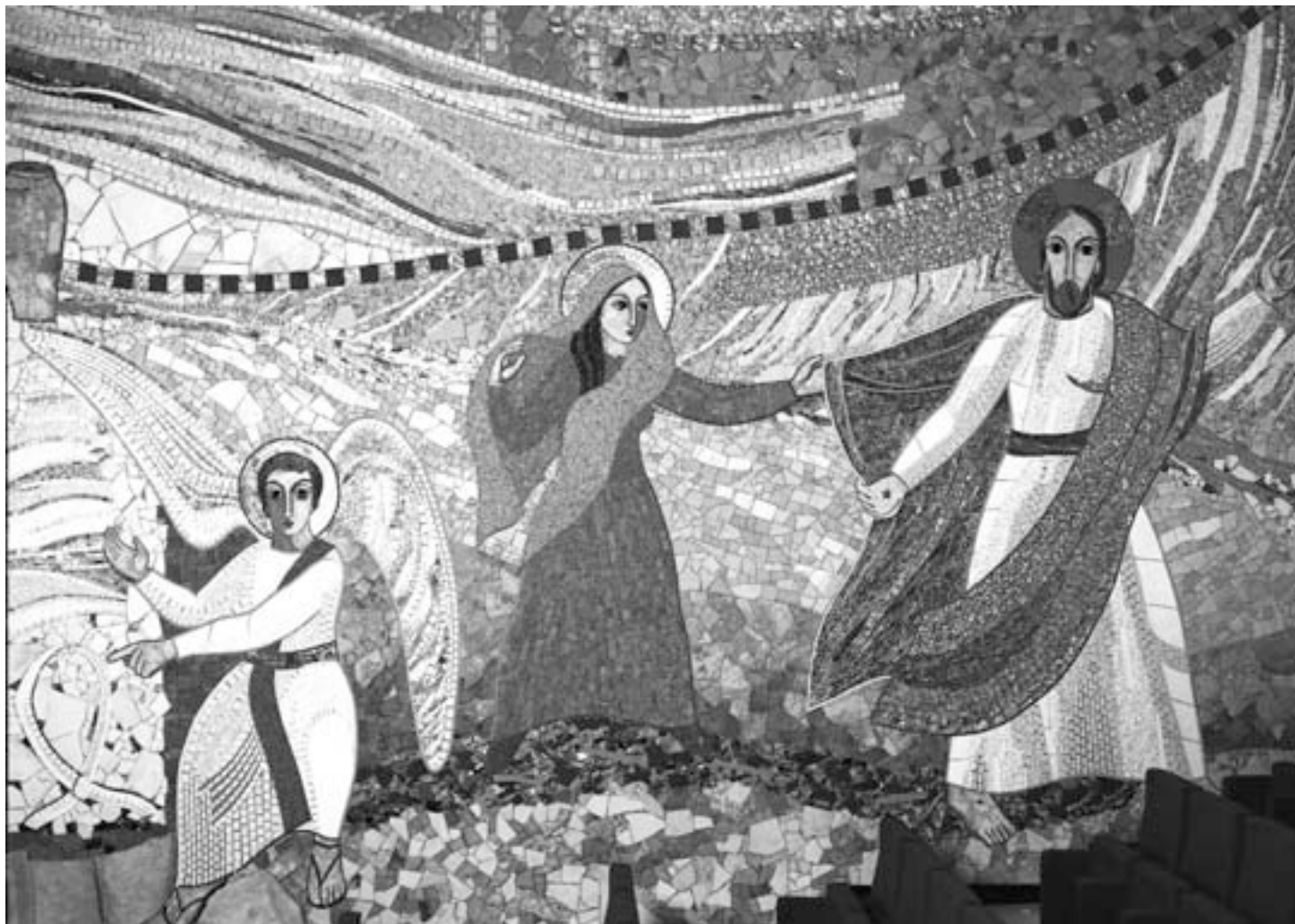
“Ne oklepaj se me!” – Madrid