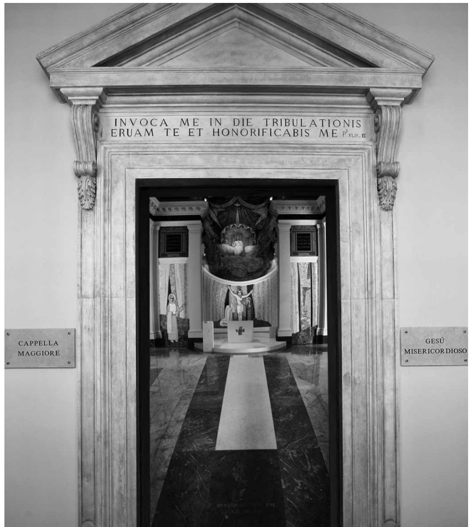
Zgoraj in desno: Kapela poliklinike Umberto I v Rimu

Kaj je namreč kruh? Kristusovo telo je. Kaj postajajo tisti, ki ga prejemajo? Kristusovo telo (sv. Janes Zlatousti). Evharistija nam kakor vsi ostali zakramenti razpira razsežnosti tega občestva. Vedno gre za tridimenzionalno občestvo – z Bogom, z drugimi in s stvarstvom, ki je vključeno v to občestvo in tako postaja određeno stvarstvo, zakramentalen prostor, nova zemlja, ki izraža naše sodelovanje z močjo Svetega Duha. Po človeškem delu in naporu, v sodelovanju s Svetim Duhom, zemlja dobi obličje in začne dihati resnico sveta, ki je ustvarjen po Stvarnikovi zamisli. Prav to se zgodi pri bogoslužju in pri zakramentih. Zato se Cerkev zaveda, da mora nameniti veliko pozornosti prostoru, v katerem slavi svojega Gospoda. Bogoslužni prostor ima svoj temelj v sami istovetnosti Cerkve in v tem, kar se v njej obhaja. Gre za živi prostor, v kolikor gosti življenje, za katero je bil ustvarjen. Svetišče je zakramentalni prostor Cerkve in prav zato cerkev-zgradba razodeva stvarnost Cerkve. Red nebeške Cerkve mora