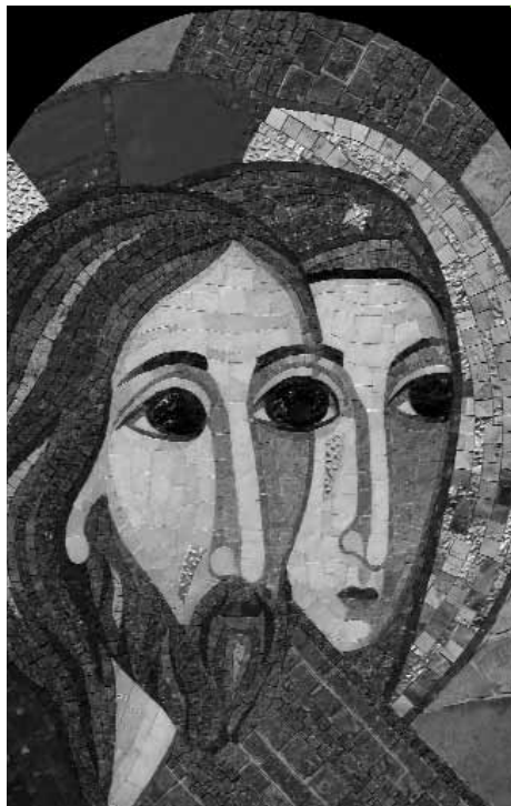
JEZUS SREČA SVOJO MATER, Križev pot na Mengorah Volčce - Tolmin