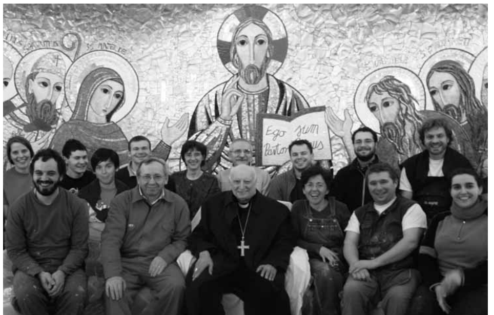
UMETNIKI S PATROM ŠPIDLÍKOM V KAPELI PAPEŠKEGA IRSKEGA KOLEGIJA V RIMU

Šefa poznate, on nima zobobola. Manuela, tajnica, mu ga skušam povzročiti.