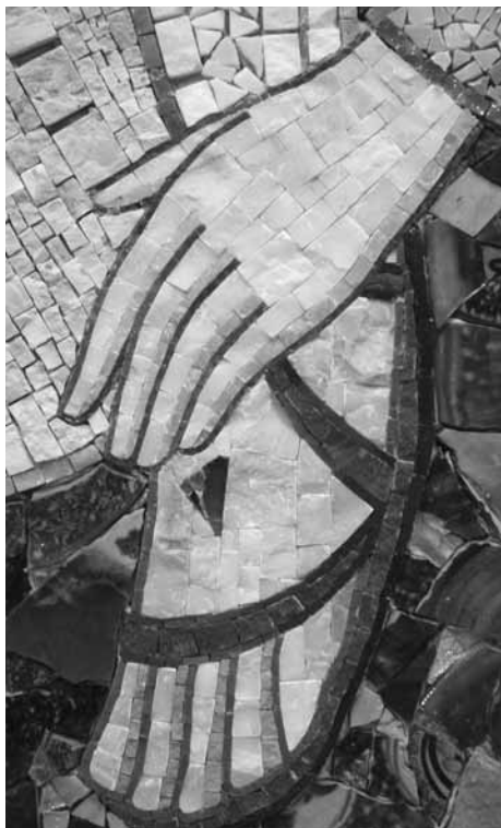
VSTAJENJE, DETAJL (CALTAGIRONE - SICILIJA)

»Prijela sem ga in ga nisem spustila, dokler ga nisem pripeljala v hišo svoje matere, v izbo nje, ki me je spočela«, zaključila zaročenka v Visoki pesmi po dolgem iskanju svojega ljubega.