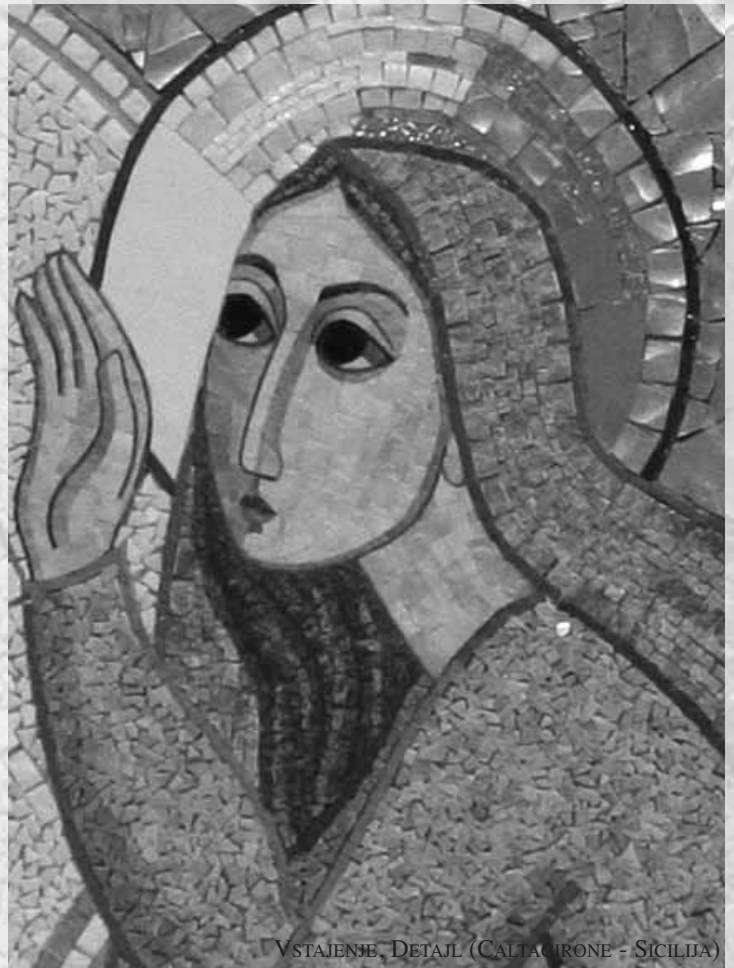
VSTAJENJE, DETAJL (CALTAGIRONE - SICILIA)